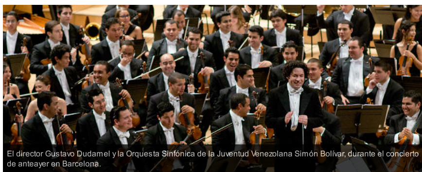
El director Gustavo Dudamel y la Orquesta Sinfónica de la Juventud Venezolana Simón Bolívar, durante el concierto de anteayer en Barcelona.

Obtén Recetas y Menús para Celebrar tus Fiestas Favoritas y Ocasiones! www.elmejorido.com